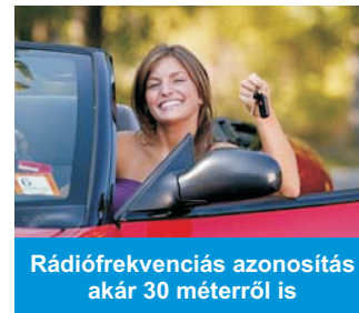
Rádiófrekvenciás azonosítás akár 30 méterről is