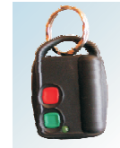
EP-DWB-100H-T típusú 2 csatornás kézi jeladó