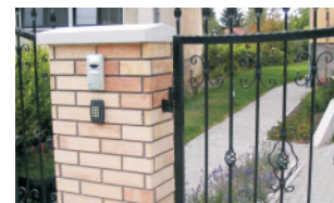
PIN kódos belépés

Cím: EUROPROX Bt. H-8000, Székesfehérvár Turóci utca 28/A.