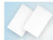
MagicProx-HID Clamshell kártya (fehér, bankkártya méretű)