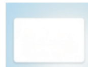
MagicProx-HID ISO proximity kártya (fehér, bankkártya méretű)