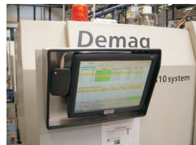
Dolgozó azonosítás termelésirányítási rendszerben

* Az olvasási távolság függ a telepítési környezettől.